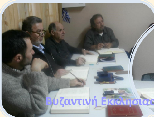
Βυζαντινή Εκκλησιαστική Μουσική