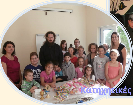
Κατηχητικές Νεανικές Συντροφίες